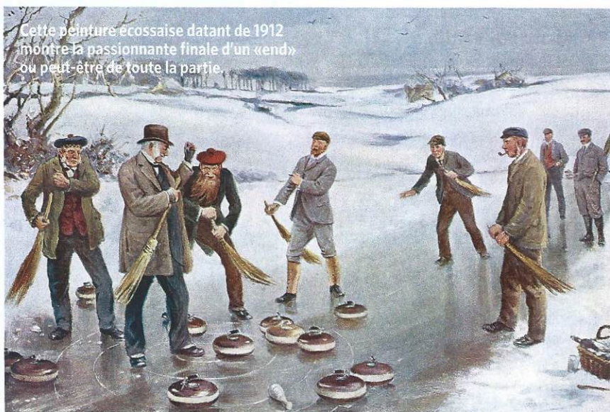
Cette peinture écossaise datant de 1912 montre la passionnante finale d'un «end» ou peut-être de toute la partie.

En Suisse, le curling a vu le jour à Saint-Moritz (GR). Comme tant d'autres sports, il y a été importé, en 1880, par des hôtes britanniques. Puis la Suisse a représenté un petit eldorado du curling grâce à la qualité de la glace, le keen ice , particulièrement durable en raison de l'altitude. Au fil du temps, le curling est