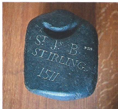
La plus vieille pierre de curling retrouvée remonte à l'an 1511. Elle porte l'inscription «St. J. S. B. Stirling» et est donc nommée pierre de Stirling.

devenu de plus en plus populaire parmi les autochtones. Beaucoup de clubs ont vu le jour dans les années 1920. Mais il aura fallu attendre encore quarante ans avant que les femmes soient tout à fait acceptées. Le premier Championnat du monde s'est déroulé en 1959 en Écosse, mais le curling n'est devenu sport olympique qu'en 1998, à Nagano (Japon). La Suisse a d'ailleurs remporté l'or.